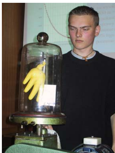
Rękawiczka pod kloszem próżniowym