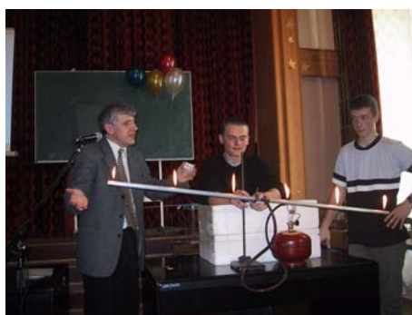
Rura z gazem